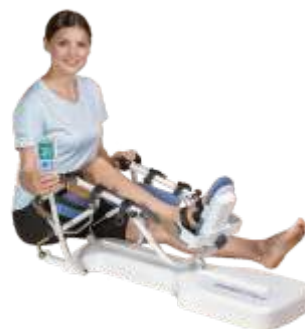
ORMED FLEX 01 ACTIVE

Для коленного и тазобедренного суставов, пассивная разработка