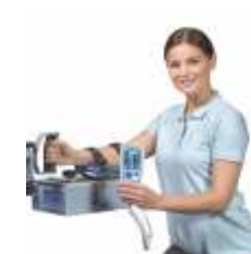
ORMED FLEX 05