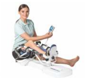
ORMED FLEX 01

Для коленного и тазобедренного суставов, пассивная разработка