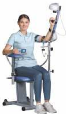
ORMED FLEX 03