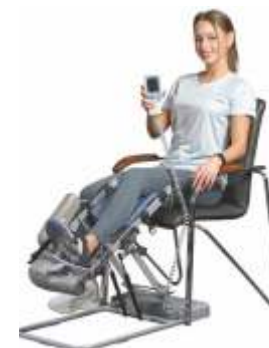
ORMED FLEX 02

Для коленного и тазобедренного суставов, пассивная и активная разработка