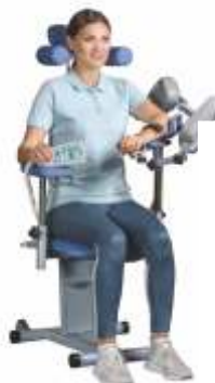
ORMED FLEX 04